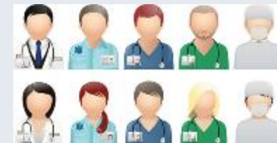
Mitarbeiter im Gesundheitswesen